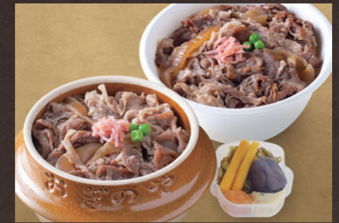
峠の牛めし 上州牛を使用