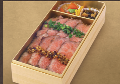
上州牛 ステーキ弁当(特上) 2,700円