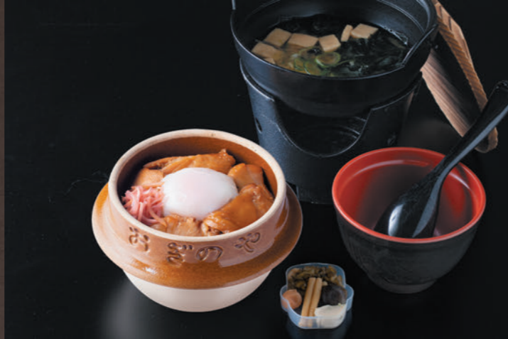
峠の鶏めし 味噌汁鍋 1,450円