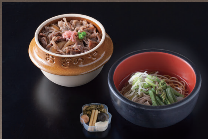
峠の牛めし 山菜そば 1,650円