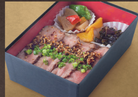
上州牛 ステーキ弁当(上) 1,620円