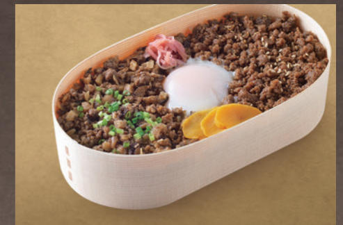
上州牛そばろ弁当 980円