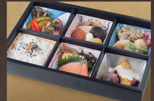
六桁弁当 雅 2,600円