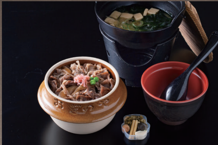
峠の牛めし 味噌汁鍋 1,450円