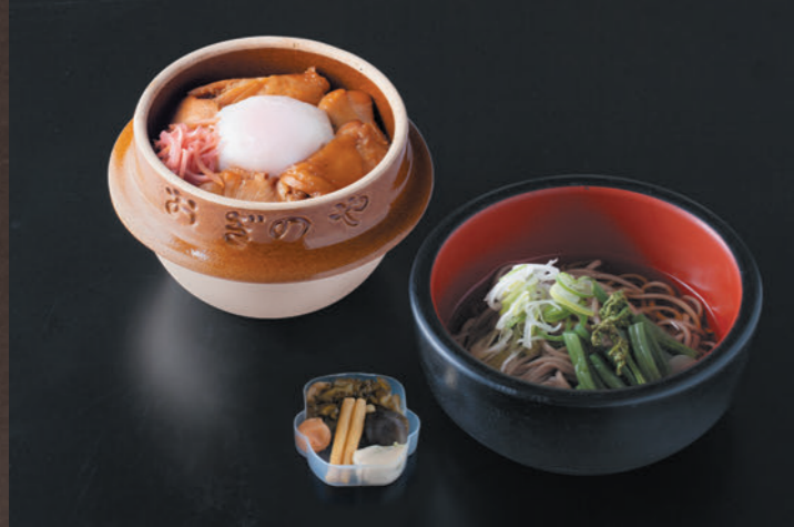
峠の鶏めし 山菜そば 1,450円